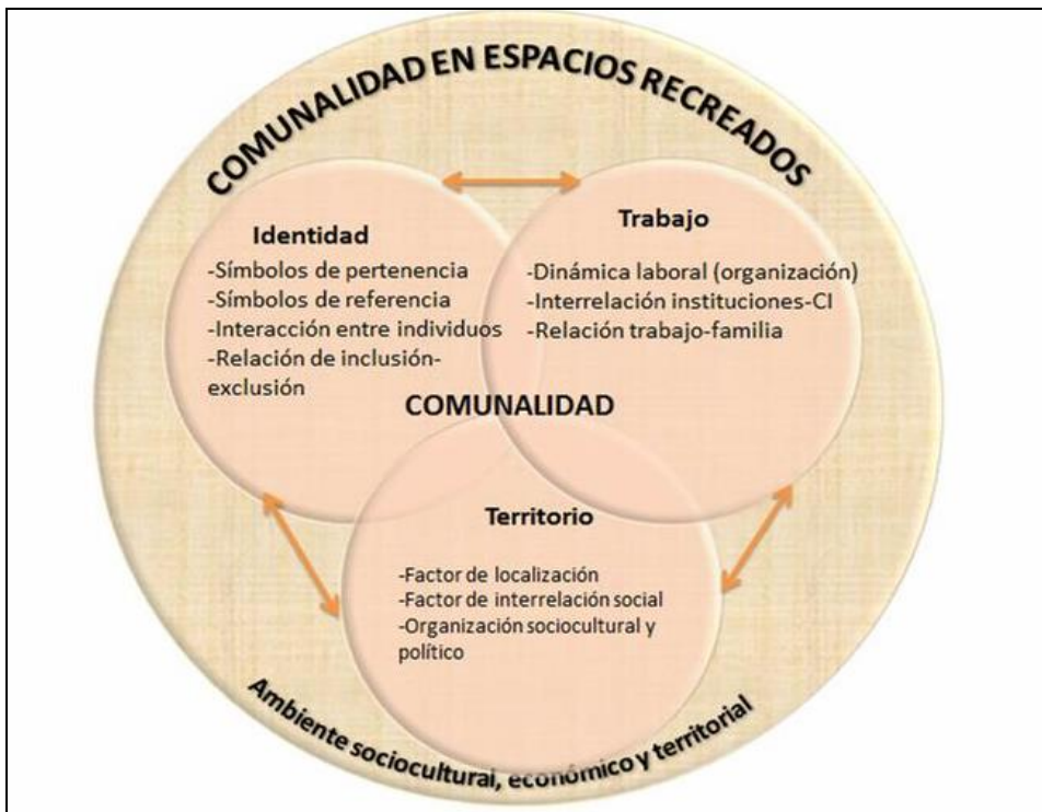
Figura 01: Elementos y unidades de análisis de la comunalidad en espacios re-creados.

integración dentro de la economía regional, los modos de producción y las relaciones de intercambio con la finalidad del beneficio colectivo o posibles relaciones o lazos. Es por ello que se debe abordar las unidades productivas en sus distintas dimensiones, las dinámicas laborales desde el contexto histórico, tanto del territorio origen como del territorio re-creado, la intervención de actores externos en la vida cotidiana, y los tipos de trabajo y percepción económica, que dichas comunidades adquieren en ese nuevo contexto social. A la vez la identificación de la relación trabajo-familia en el ámbito laboral en este nuevo contexto permite asociar ciertos patrones de conducta posiblemente adquiridos desde el territorio origen y otros asociados al devenir del proceso histórico y espacial. La articulación y análisis de los elementos de la comunalidad, se muestran en la Figura 01, indicando las categorías de análisis propuestas para cada uno de estos componentes.